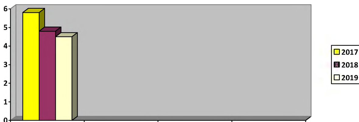
Диаграмма 1 - Результат заболеваемости детей в случаях на одного ребенка.

Мониторинги, проводимые в МАДОУ ЦРР № 19, позволили сделать вывод, что педагогическому коллективу удалось выполнить поставленные перед коллективом задачи.